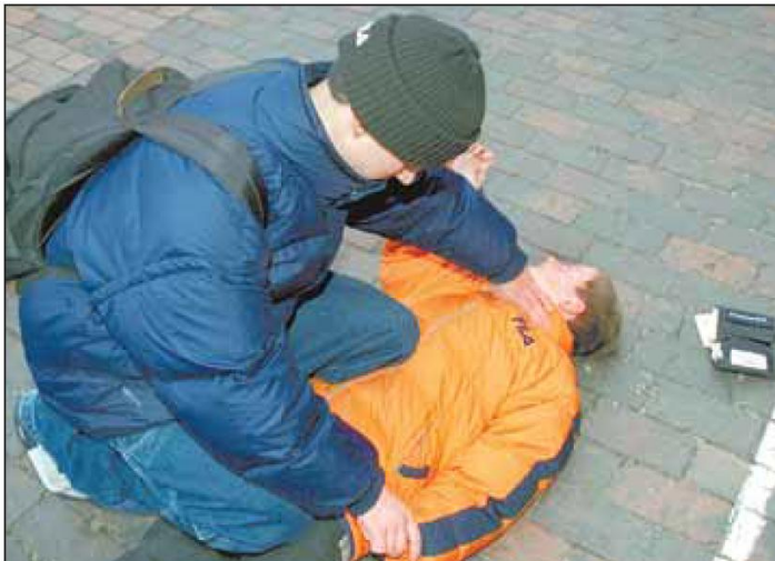
Mobbing hat viele Gesichter: Oftmals folgt auf Beleidigungen und Verunglimpfungen offene Gewalt.

> Wenn die Situation allerdings wirklich als ernst eingestuft wird, sollten Eltern ihrem Kind gegebenenfalls neue Daten wie Handynummer oder Mailadresse besorgen. Außerdem sollten sie mit Sohn oder Tochter vereinbaren, dass sie nicht auf die Online-Attacken reagieren. Denn: „Der Täter lebt von einer Rückmeldung“, sagt Heinz Thiery. dpa