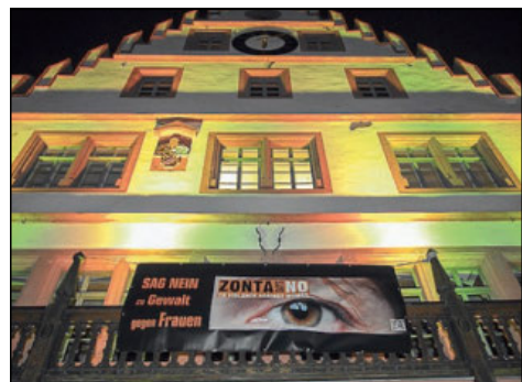
Der Zonta Club hat das Alte Rathaus am Montagabend illuminiert lassen.